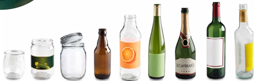
Bouteilles, pots et bocaux