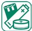
PILES ET ACCUMULATEURS

Ne pas mettre : les ampoules à filaments