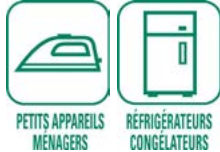
PETITS APPAREILS MÉNAGERS RÉFRIGÉRATEURS CONGÉLATEURS