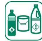
DÉCHETS DIFFUS SPÉCIFIQUE (DDS)