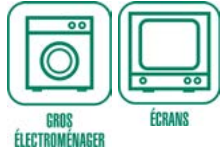
GROS ÉLECTROMÉNAGER ÉCRANS